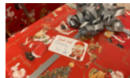
JULEHJÆLP MBUO STØTTEDE MED GAVER TIL BØRNE