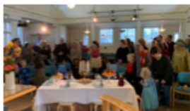
FASTELAVNSFEST ALLE GENERATIONER SAMLET OM KIRKE