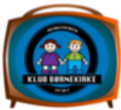
VIDEO BØRNEKIRKE 10 + UGERS ONLINE VIDEO UDSENDELSER