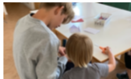
SOMMER UGE 27 FERIE AKTIVITETER I KIRKEN FOR BØRN