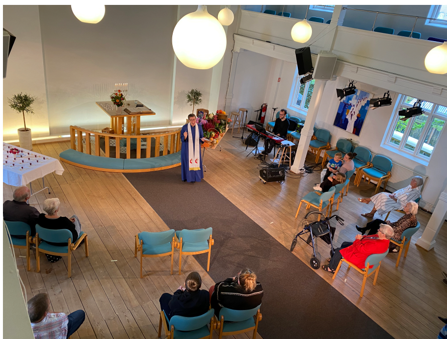
Gudstjeneste med Corona-sikker afstand og masser af sprit.