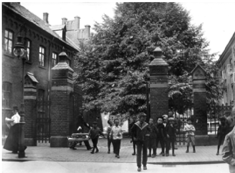
Indgangen til Gråbrødre Kloster fra Jernbanegade, som den tog sig ud omkring 1910.

Da en af de indbudte foredragsholdere vil fortælle om klostre i Odense, har vi taget nedenstående billede med som en appetitvækker. Men alle tre foredragsholdere har spændende ting at fortælle os.